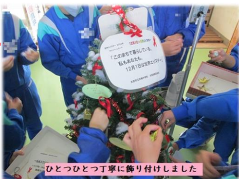
ひとつひとつ丁寧に飾り付けました

来賓玄関に、レッドリボンをモチーフとしたツリーを展示しました。エイズに関する資料なども飾ってありますので、近くを通った時にはぜひ見てください。