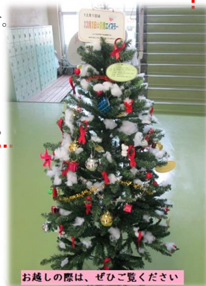
お越しの際は、ぜひご覧ください

来賓玄関に、レッドリボンをモチーフとしたツリーを展示しました。エイズに関する資料なども飾ってありますので、近くを通った時にはぜひ見てください。