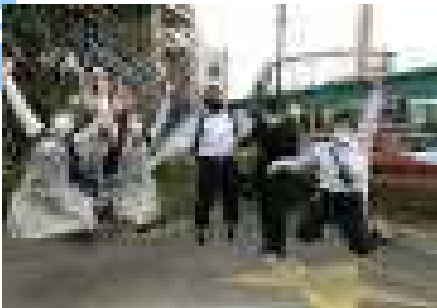
【那須ハイランドパークにて】