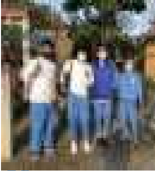
【国宝 武人埴輪のブリカ前で】

九合村物語～77の秘密～をもとに、地域のかげがえのない地域遺産をフィールドワークを通して調べています。身近な地域の素晴らしさを再発見。いやいやもしかしたら新発見だったかもしれません。