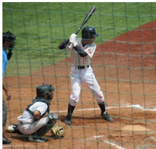
〈野球部の試合の様子〉