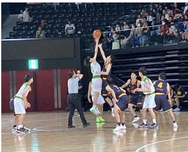
〈男子バスケットボール部の試合様子〉

ところで、県大会に出場する生徒は現在までで20人(陸上部14人、女子ソフトテニス部4人、バドミントン部1人、テニス部1人)ですが、水泳部の活躍次第では増える予定です。7月12日(土)から県内各地が始まりますが、応援よろしく願いいたします。