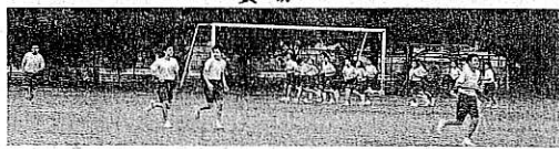
▲体育持久走の授業の様子