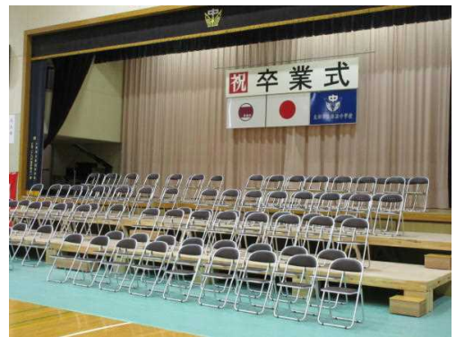
きれいに準備された卒業式会場

8日、9日と群馬県公立高校後期選抜があり、多くの3年生が試験に挑みました。入試のない生徒たちは、1年間過ごした教室を中心に清掃に取り組み、とてもきれいにしてくれました。ほぼ全員そろった昨日(10日)、卒業式の予行を行いました。きちんとした態度で堂々と振る舞う3年生たちは、とても立派でした。今日は間違いなく素晴らしい卒業式になる、そう感じています。式場を中心とした会場作りや清掃など、在校生と職員が一生懸命に行いました。卒業を祝う温かな心に包まれた卒業式にしていきたいと思えます。