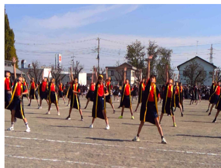
個の輝きと集団の美を感じた旭ソーラン

一人一人の活躍と集団の美が見られる小学校の運動会。その過程で子どもたちは大きく成長します。これこそが学校教育で運動会をやる意味だと強く思っています。