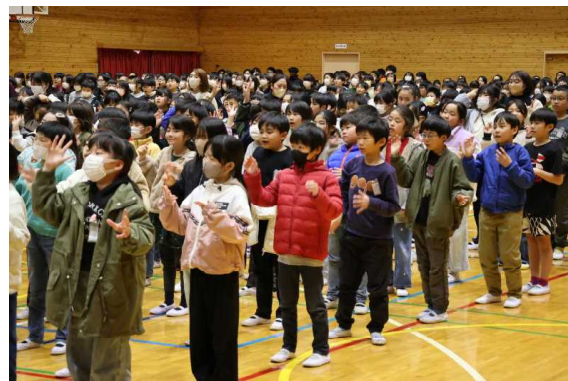
お礼に「虹」の全校合唱をプレゼント