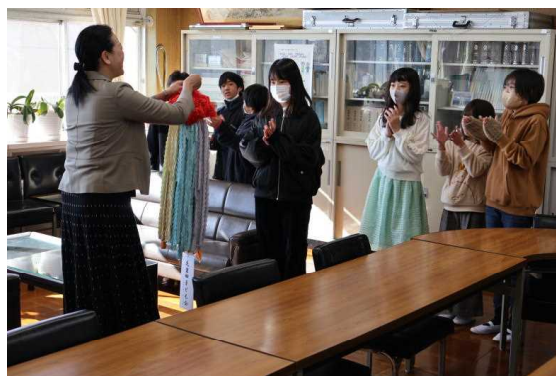
今年も毛里田子育連の子ども役員より交通安全を祈願して千羽鶴が贈られました。