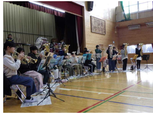
1月21日(火)音楽集会の様子

1月13日(月・祝)に太田市民会館で、第38回太田市小学校金管バンド演奏発表会が開催されました。毛里田小金管バンド部員20名が参加し、「最高到達点」「新宝島」の2曲を演奏しました。これまでの練習の成果を発揮し、心一つにすばらしい演奏を披露しました。一人一人の音色と一生懸命に演奏する姿は、聴く人の心を打つものでした。