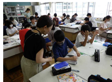
6年生の家庭科ボランティア

◇本部役員は、地区から候補者を選出するのではなく 全家庭から立候補または推薦で候補者を募ります。 ◇専門部をなくし、学年委員の選出も行いません。 ※3学期の授業参観での来年度役員選出はありません。