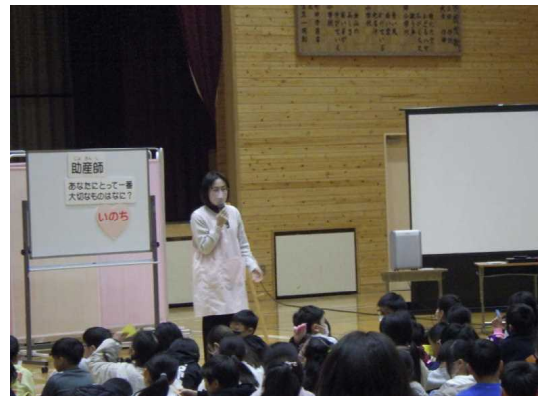
4年生 助産師さんによる「命の授業」