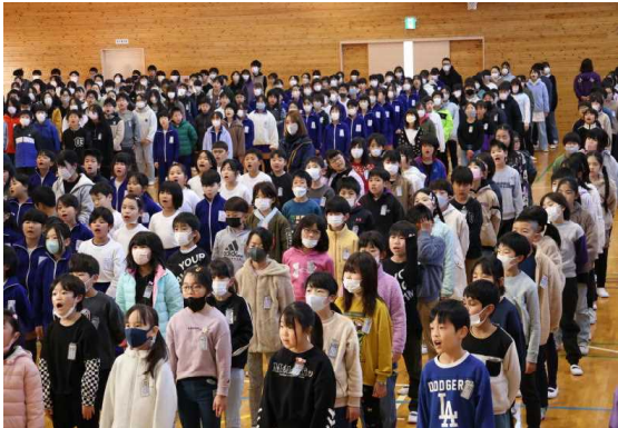
校歌を大きな声で元気に歌います♪

来週28日には、6年生を送る会が予定されています。今までお世話になった優しい6年生のお兄さん、お姉さんに、全校で精一杯の感謝の気持ちを伝えます。