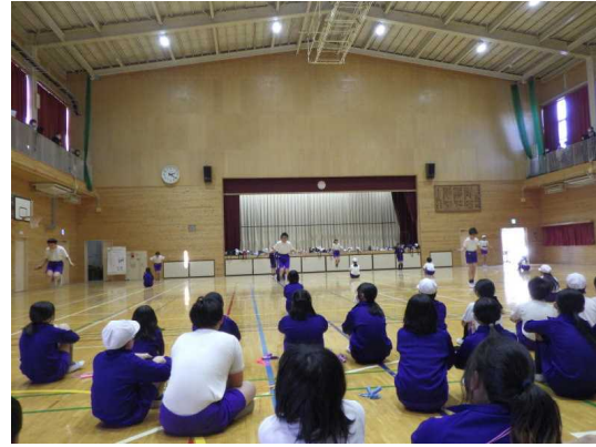
5年生 なわとび大会