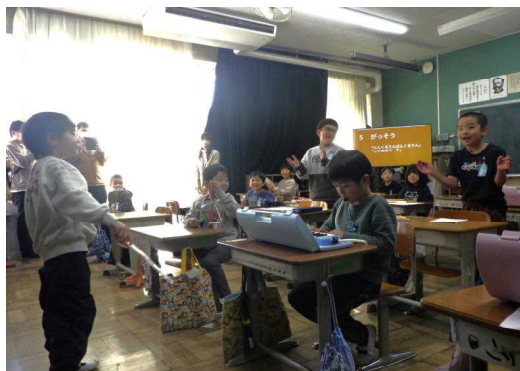
1年生 「できるようになったこと」