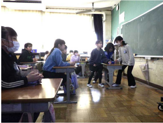
3年生 学習オリンピック