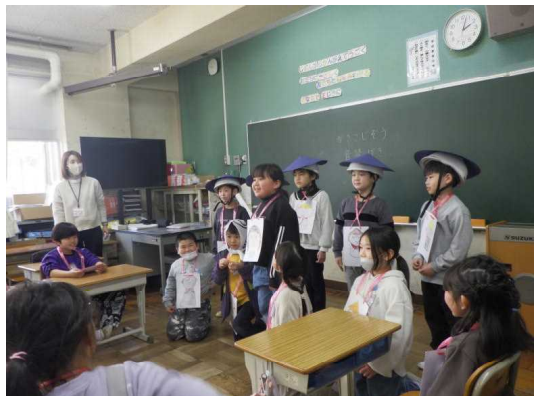
2年生 音読劇「かさこじょう」