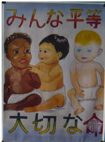
人権ポスター5年生代表