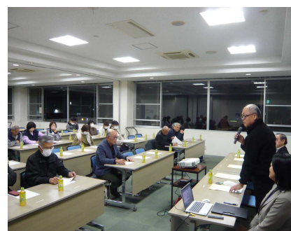
赤石会長のごあいさつ