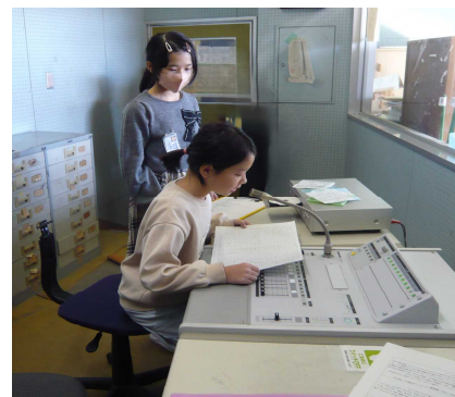
お昼の放送による人権作文の発表