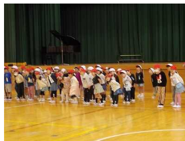
【1年生の歌とダンス】