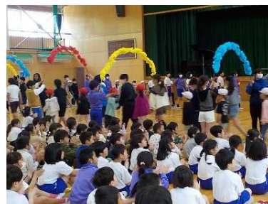
【6年生と一緒に入場】