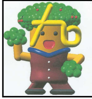
せんちゃん 九合小イメージキャラクター