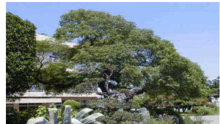
【シンボルツリーのせんだん】

九合小のシンボルツリーである梅檀（せんだん）。古くは「万葉集」に収められている和歌にも詠われており、「梅檀（せんだん）は双葉（ふたば）より芳（かんば）し」ということわざもあり、「大成する人は、子供の時から優れた面をもっている。」という意味を表します。このことわざに出てくるせんだんは、香木として名高いびゃくだん（白檀）のことを指しますが、校歌にも歌われているせんだんやびゃくだんのように九合小の児童には、小さいころから自分らしい輝きを放ち、健やかに育ててほしいと願っています。